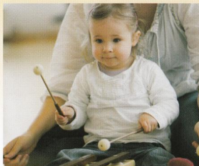
Eltern- und Kleinkinder erleben Musik